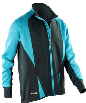
Navy / Blue