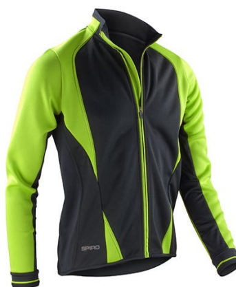
Black / Neon green