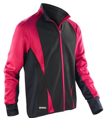
Black / Magenta