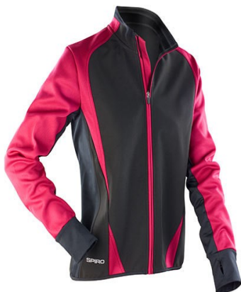
Black / Magenta