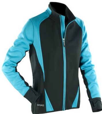
Black / Blue