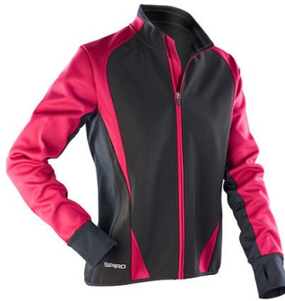
Black / Magenta

lieferbar in Farben: Black / Blue, Black / Neon green, Black / Magenta