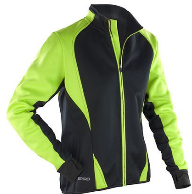
Black / Neon green