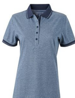
blue melange/ navy