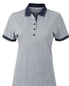
heathergrey melange/ navy