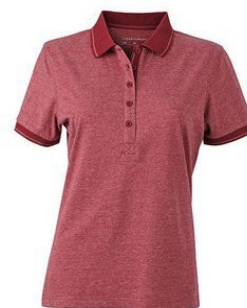
wine melange/ wine