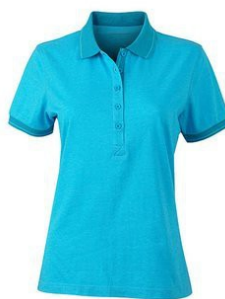
turquoise melange/ turquoise