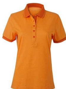
orange melange/ darkorange