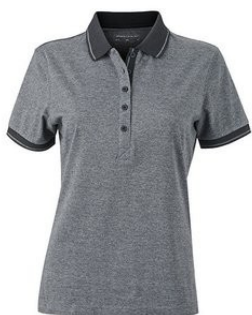
black melange/ black