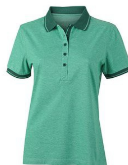
green melange/ darkgreen