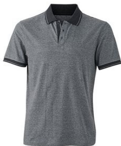
black melange/ black