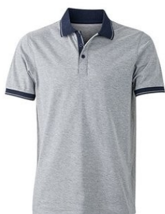
heathergrey melange/ navy