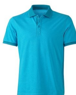
turquoise melange/ turquoise