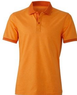
orange melange/ darkorange