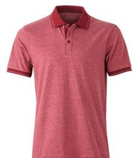
wine melange/ wine