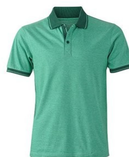
green melange/ darkgreen