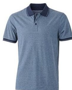
blue melange/ navy