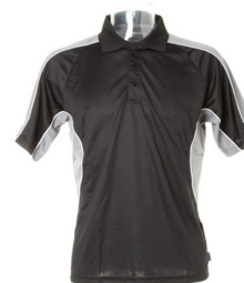
Black / grey