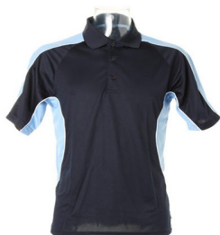
Navy / light blue