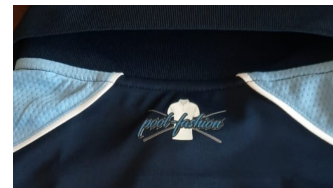
navy / light blue

lieferbar in Farben: black/red, black/grey, navy/light blue, black/orange,