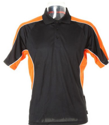
Black / orange