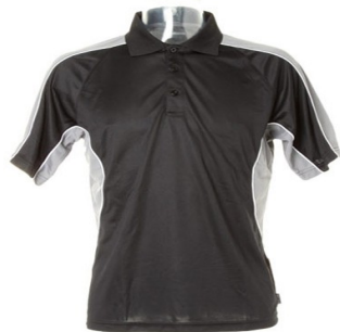
black / grey